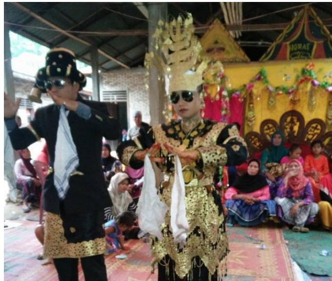
Gambar 1. Tor-Tor ni Bayo Pangoli dohot Boru Panoli