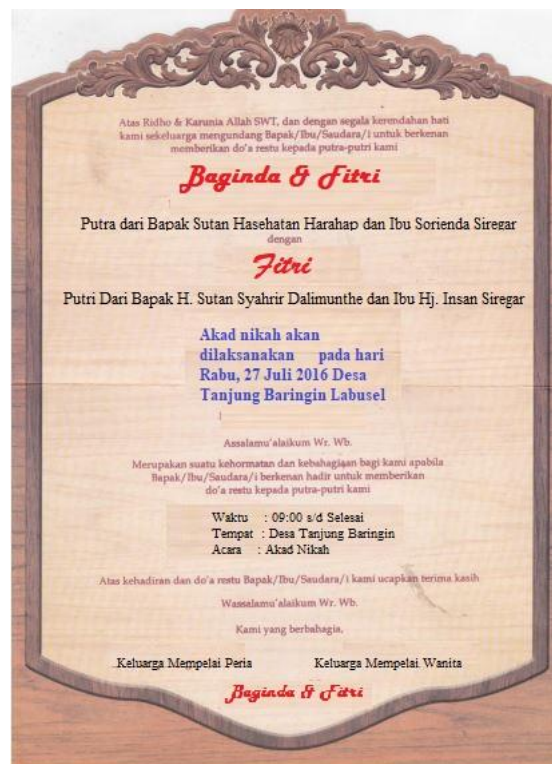
Gambar 2. Undangan