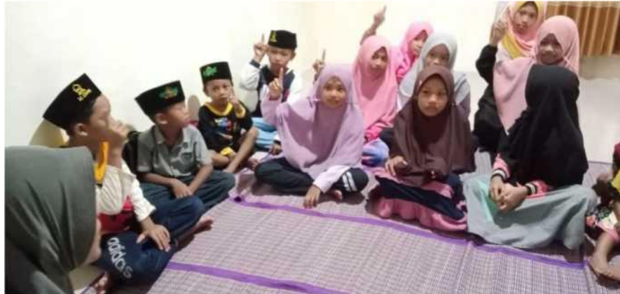
Gambar 2. Interaksi dalam penyampaian materi

Dalam sosialisasi dengan anak-anak tak lupa selalu memberikan hiburan-hiburan yang membuat mereka senang sehingga penyampaian yang penulis inginkan dapat tersampaikan dengan baik. Adapun materi pokok yang disampaikan adalah efek negatif dari game online yakni menurunnya semangat belajar, merusak kesehatan, dan kurangnya bersosialisasi dengan teman sebaya.