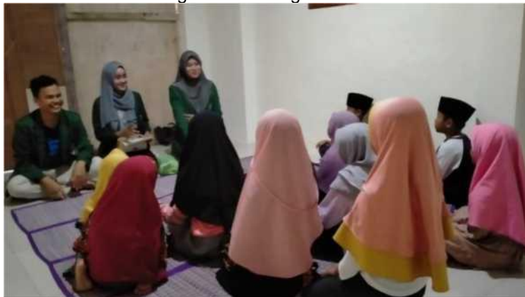
Gambar 1. Penyampaian materi bahaya game online bagi anak-anak

Pengabdian masyarakat ini dilaksanakan di salah satu rumah warga yang biasanya digunakan untuk belajar bersama dengan anak-anak di Desa Gutomo. Pada tahap pertama yakni tahap sosialisasi yang dilaksanakan dengan metode diskusi dua arah. Karena objek kami adalah anak-anak, maka kami berusaha untuk komunikatif dengan mereka agar tidak terkesan membosankan.