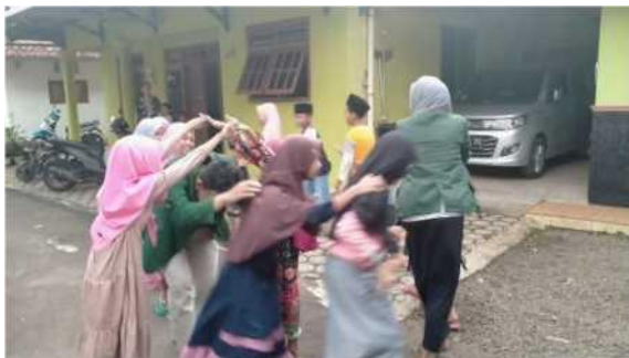
Gambar 4. Permainan Kereta Terowongan.