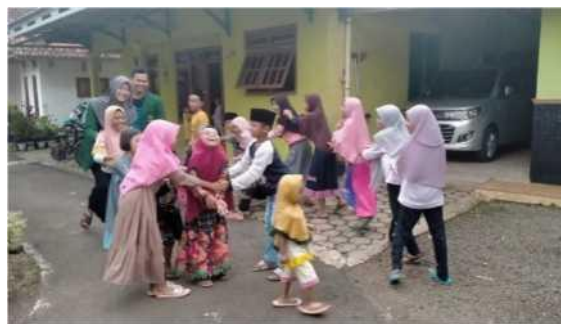
Gambar 5. Permainan tradisional

Dalam penerapannya diharapkan dengan adanya sosialisasi yang dilakukan oleh penulis dapat membantu pelestarian permainan tradisional dan juga menjadi awalan yang bisa diikuti oleh pemuda lain dalam upaya pelestarian permainan tradisional di lingkungan sekitar. Sebagai seorang pemuda sudah saatnya untuk berkembang untuk meraih masa depan, namun tak luput juga dari usaha menjaga apa yang sudah ada bersama kita dalam proses berkembangnya seorang anak menjadi pemuda pembawa perubahan. Globalisasi tidak bisa dihindari dalam kehidupan bermasyarakat, untuk itu menyaring apa yang buruk, mengambil apa yang baik, dan menjaga tradisi adalah hal yang paling tepat bagi generasi masa kini. Diharapkannya para penerus bangsa tidak lupa dengan apa yang membesarkannya. Yakni budaya dan tradisi.