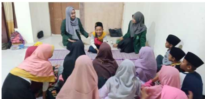
Gambar 3. Interaksi audiens dalam penyampaian materi permainan tradisional

Tahapan selanjutnya yakni penyampaian mengenai pelestarian permainan tradisional. Dimana permainan tradisional harus dilestarikan oleh generasi penerus bangsa sebagai penepis dari buruknya efek penggunaan game online. Selain menumbuhkan jiwa kebersamaan, permainan tradisional dapat menyehatkan tubuh, tubuh bugar adalah kondisi ideal bagi anak-anak untuk menjalani harinya. Dengan bersenang-senang namun memberikan pengaruh yang baik bagi tubuh adalah apa yang bisa kita dapatkan dari permainan tradisional.