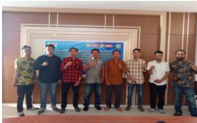
Gambar 5. Kegiatan Persidangan dan Pembelaan Hukum dalam Sengketa Perizinan OSS-RBA di PTUN Law Office 108 Kota Mataram

Dampak tersebut antara lain: Meningkatnya pemahaman terhadap sistem perizinan digital, meningkatnya kemampuan analisis hukum administrasi negara, terbentuknya keterampilan litigasi berbasis bukti elektronik, meningkatnya kepercayaan diri dalam menangani perkara PTUN. Selain itu, pelatihan ini juga mendorong perubahan paradigma advokat dari pendekatan konvensional menuju pendekatan modern yang berbasis teknologi hukum ( legal tech oriented practice ) (Ranerup & Henriksen, 2019).