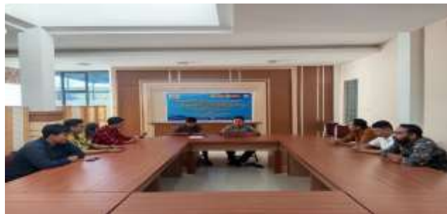
Gambar 4. Kegiatan Pendampingan dan Penyusunan Gugatan Sengketa di PTUN Law Office 108 Kota Mataram

Pelatihan di Law Office 108 Kota Mataram juga memberikan penekanan pada strategi penyusunan gugatan dalam sengketa OSS-RBA. Gugatan tidak hanya harus memenuhi syarat formil, tetapi juga harus mampu menguraikan pelanggaran hukum administrasi secara sistematis.