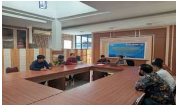
Gambar 3. Kegiatan Analisis Dokumen dan Permasalahan Perizinan OSS-RBA oleh Advokat Law Office 108 Kota Mataram

Pelaksanaan pelatihan dilakukan secara interaktif dengan melibatkan advokat, praktisi hukum, serta akademisi. Kegiatan berlangsung dalam beberapa sesi, yaitu pemaparan materi, diskusi kasus, dan simulasi persidangan.