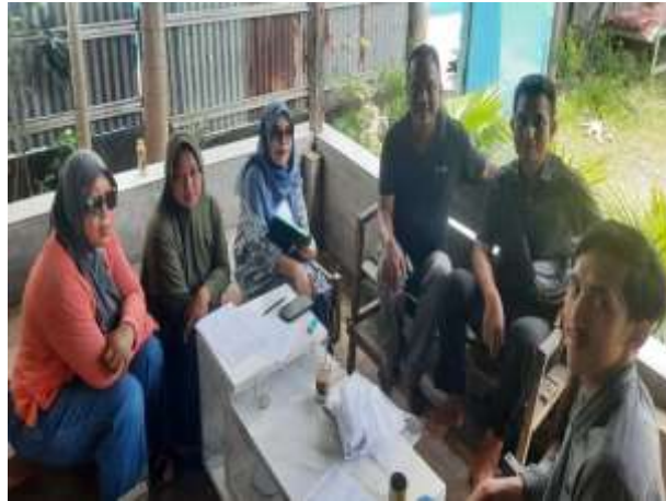
Gambar 2. Koordinasi dengan mitra sebelum pelaksanaan pengabdian

Pelaksanaan pengabdian ini diawali dengan identifikasi masalah dan perancangan solusi yang relevan oleh tim. Selanjutnya, dilakukan penyusunan jadwal dan rencana kerja, penentuan jumlah peserta, serta rincian tahapan kegiatan. Pelaksanaan kegiatan pengabdian disesuaikan dengan kegiatan kelompok tani dan UMKM opak karena mereka juga mempunyai rutinitas yang cukup padat setiap harinya. Tim juga melakukan koordinasi internal dengan dosen dan mahasiswa yang terlibat untuk pembagian tugas. Persiapan alat dan bahan sebelum kegiatan pelatihan seperti pembuatan alat pirolisis, membuat lubang untuk penempatan soil pit serta membersihkan dan mengolah lahan demplot percobaan. Materi kegiatan pelatihan biochar dan digital marketing serta modul panduan membuat akun e commerce disiapkan untuk mendukung kelancaran pelatihan.