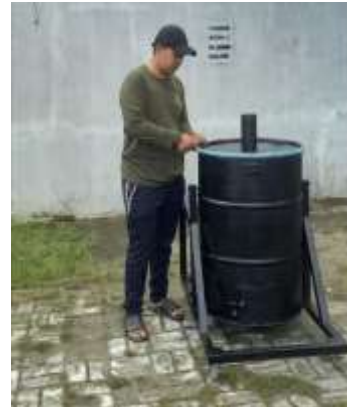
Gambar 6. a). Desain dan bentuk jadi alat pirolisis soil pit b). lubang untuk menempatkan alat pirolisis soil pita, c). Desain dan bentuk jadi alat pirolisis sistem tertutup.