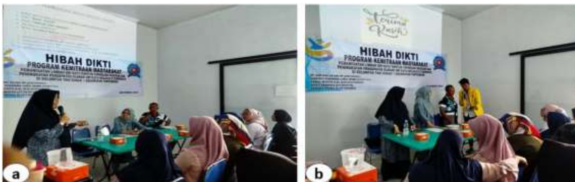
Gambar 8 a). kegiatan pelatihan dan pemaparan materi pasar digital b). tim pengabdian membuat akun bisnis mitra di platform digital

Tim pengabdian mendemonstrasikan dan mengarahkan peserta untuk membuat akun bisnis di market place dan media sosial. Kendala yang dihadapi dalam pelatihan ini adalah peserta belum terbiasa dengan teknologi digital dan tidak tahu cara memasarkan produk di pasar digital, walaupun sebagian besar sudah mempunyai akun pribadi di media sosial tapi mereka tidak tahu cara membuat foto profil produk, membuat konten dan mengelola akun. Keterbatasan akses internet menjadi hambatan pada saat kegiatan pelatihan dilakukan. Peserta menyatakan bahwa mereka sebelumnya tidak percaya diri untuk berjualan di platform digital setelah diberikan pelatihan dan bisa membuat dan memposting produk sendiri. Kegiatan pelatihan ini bisa menjadi solusi bagi mitra dalam melakukan promosi produk melalui platform digital. Hasil pelatihan menunjukkan bahwa mitra berhasil membuat akun bisnis aktif di market place (shopee dan tokopedia). (Purwaningrum et al. , 2024) menyatakan bahwa digital marketing merupakan aktivitas pemasaran yang mengintegrasikan teknologi internet untuk mendistribusikan barang atau jasa kepada konsumen. Sistem ini memungkinkan penyebaran informasi secara masif dan cepat, sehingga memutus batasan waktu yang ada pada metode konvensional. Penerapan strategi melalui media sosial pun dianggap sebagai salah satu teknik paling efektif untuk meningkatkan volume penjualan secara signifikan.