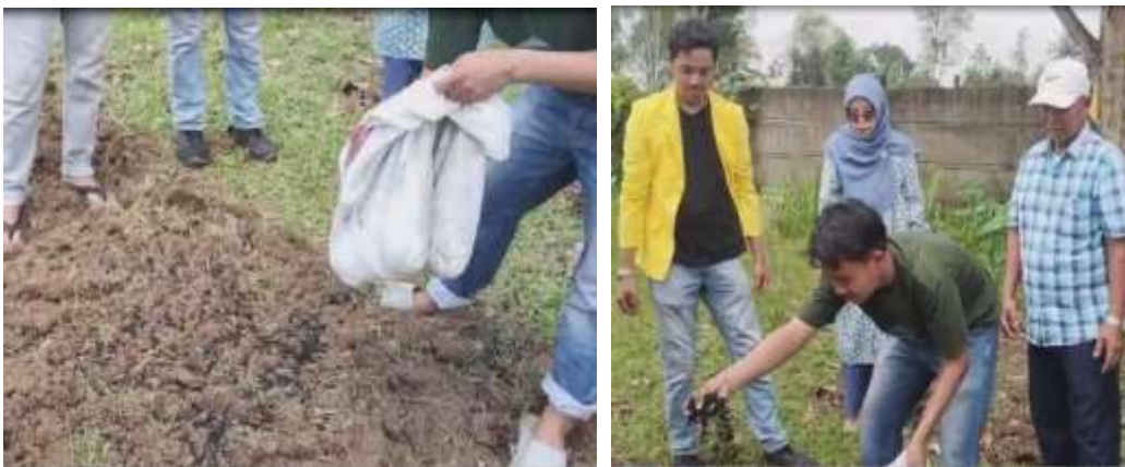
Gambar 7. Proses aplikasi biochar ke demplot percobaan

Tim menjelaskan cara mengaplikasikan biochar ke tanah dan peserta mempraktekkannya . Untuk tanaman yang rapat seperti ubi kayu bisa diberikan dengan larikan dan menyebarkan biochar di tanah. Selanjut demplot percobaan ditanami stek ubi kayu untuk dilakukan pengamatan visual pertumbuhan tanamannya yang dilakukan bersama tim pengabdian dan mitra pada saat evaluasi dan monitoring setelah kegiatan pengabdian. Hasil pelatihan menunjukkan antusiasme tinggi dari kelompok tani, yang memahami potensi biochar dalam meningkatkan produktivitas pertanian sekaligus menjaga keberlanjutan lahan.