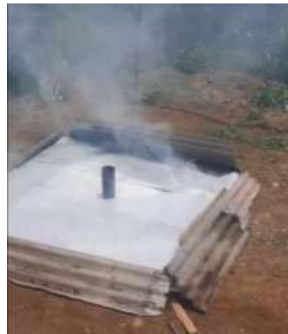
Gambar 5. Proses pembuatan biochar dengan alat pirolisis sistem terbuka (soil pit)

Biochar yang dihasilkan dari proses pirolisis dijemur kering dan selanjutnya dihaluskan dengan menggunakan mesin penepung arang. Penghancuran atau penghalusan biochar merupakan hal yang