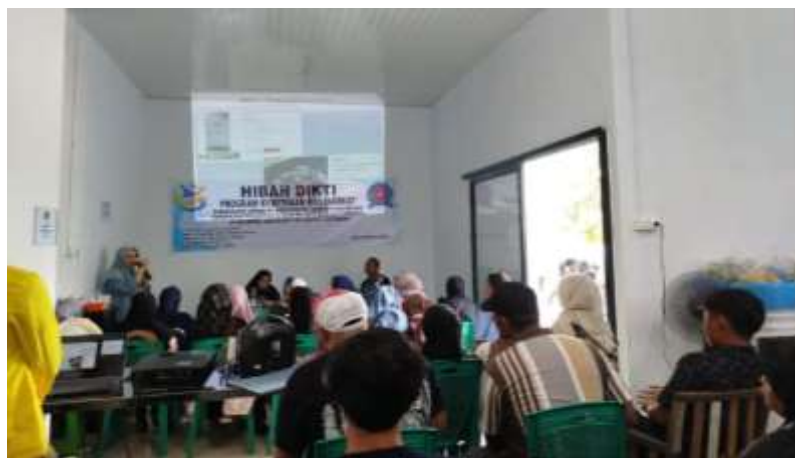
Gambar 4. Pemaparan pemanfaatan limbah pertanian melalui teknologi biochar untuk meningkatkan kesuburan tanah

Kegiatan pengabdian masyarakat dilaksanakan di lokasi mitra UD. Sun Jaya Mandiri Gang Bina Karya Dusun 1 Desa Tuntungan I Kecamatan Pancur Batu. Partisipan kegiatan ini adalah mitra UD. Sun Jaya Mandiri, kelompok UMKM opak dan petani ubi kayu dengan peserta 30 orang. Pelaksanaan kegiatan pelatihan ini diawali dengan membagikan kuesioner untuk mengukur pengetahuan peserta tentang pemanfaatan limbah pertanian sebagai biochar. Selanjutnya pemateri menjelaskan tentang pengertian dan manfaat limbah pertanian, biochar dan manfaatnya bagi kesuburan tanah. Cara membuat biochar dengan sistem sederhana yaitu sistem terbuka dan sistem tertutup dan aplikasi biochar ke tanah. Setelah itu pemateri membuka sesi diskusi yang memfasilitasi peserta untuk bertanya jawab dan menyampaikan berbagai kendala yang mereka alami dalam budidaya ubi kayu. Peserta mengatakan bahwa mereka sering tidak memberikan pupuk kimia ke lahan karena membutuhkan biaya yang cukup besar. Maka solusi dari permasalahan mitra adalah memberikan biochar ke tanah agar tanah meningkat kesuburannya.