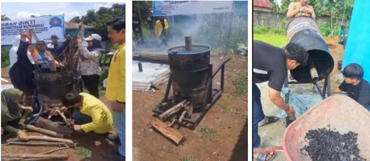
Gambar 6. Praktek pembuatan biochar dengan pirolisis sistem tertutup

penting sebelum biochar di aplikasikan ke tanah, karena dengan ukuran yang lebih kecil biochar bisa meningkatkan porositas, kapasitas memegang air dan unsur hara di tanah. Biochar dihancurkan atau digiling hingga ukuran 20 mesh (Suryani Sajar, Andi Setiawan, 2024).