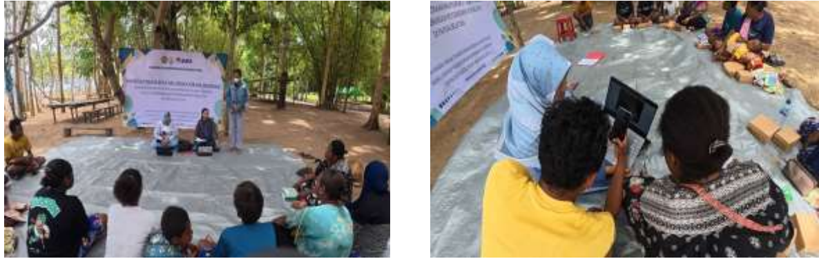
Gambar 2. Pelaksanaan Kegiatan