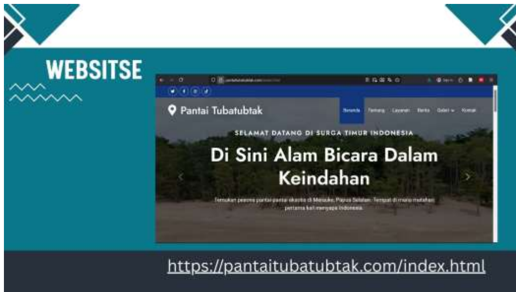
Gambar 3. Website “Pantai Tubatub Tak”

Luaran utama kegiatan PKM ini adalah pengembangan website komunitas “Pantai Tubatub Tak” sebagai sarana promosi wisata dan pemasaran produk lokal berbasis komunitas. Website ini dirancang dengan mempertimbangkan kondisi sosial dan teknologis masyarakat pesisir, serta dilengkapi dengan fitur profil destinasi, galeri visual, informasi kegiatan komunitas, dan template konten digital yang mudah diperbarui oleh anggota Pokdarwis. Keunggulan utama luaran teknologi ini terletak pada sifatnya yang sederhana, kontekstual, dan adaptif terhadap kapasitas pengguna lokal, meskipun masih menghadapi keterbatasan pada infrastruktur jaringan internet di wilayah pesisir.