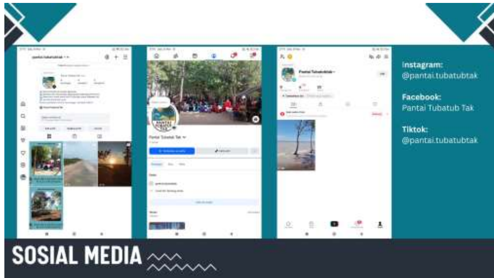
Gambar 1. Peningkatan Kapasitas Digital melalui Sosial Media