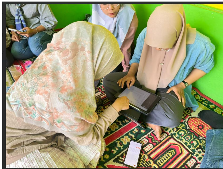
Gambar 3. Praktek pengelolaan website.

Pelatihan hari kedua praktek langsung pengelolaan website, membuat paket wisata dan pendampingan praktek pengelolaan keuangan.