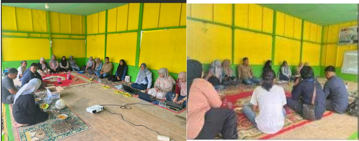
Gambar 2. Pelatihan manajemen tata Kelola wisata teritegrasi.

Pada hari pertama membahas tentang tata kelola website pariwisata dan manajemen website yang terintegrasi antara paket tour, sistem keuangan dan konten wisata.