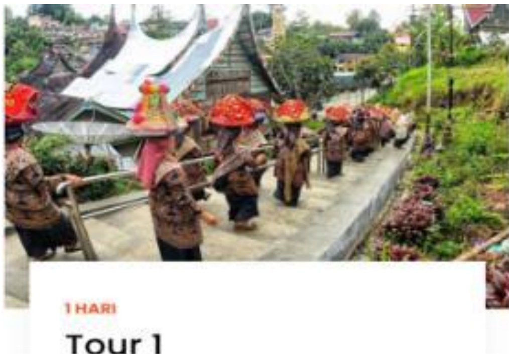
Gambar 5. Paket wisata budaya manjunjuang talam.

Website ini juga menyediakan berbagai pilihan paket tour wisata, yang dirancang sesuai dengan minat dan kebutuhan wisatawan, seperti paket wisata sejarah, paket wisata budaya, dan paket wisata alam. Setiap paket mencakup layanan pemandu lokal, transportasi, serta kunjungan ke objek-objek wisata unggulan di Nagari Pariangan.