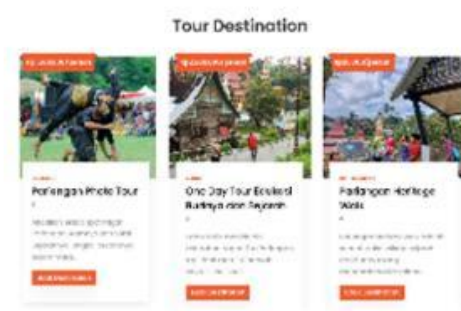
Gambar 6. Beberapa pilihan paket tour wisata.

Tahapan terakhir adalah pendampingan dan evaluasi yang difokuskan kepada Pokdarwis sebagai ujung tombak pengelolaan pariwisata di Nagari Pariangan. Kegiatan pendampingan dilakukan untuk memperkuat kapasitas Pokdarwis dalam menjalankan peran mereka, termasuk pengelolaan layanan wisata, promosi paket tour, serta pelayanan kepada wisatawan. Salah satu fokus utama dalam pendampingan ini adalah pengelolaan website pariwisata, yang menjadi media utama dalam menyebarkan informasi destinasi, aktivitas wisata, jadwal kegiatan, hingga sistem pemesanan. Pokdarwis didampingi secara teknis dan konten, mulai dari cara memperbarui informasi, mengunggah foto dan berita, hingga pengelolaan komunikasi dengan calon wisatawan melalui platform digital. Evaluasi dilakukan secara berkala untuk menilai efektivitas pengelolaan website dan keterlibatan Pokdarwis dalam menjaga kualitas serta keterbaruan konten. Tahapan ini diharapkan dapat meningkatkan kemandirian digital Pokdarwis serta memperkuat kehadiran Nagari Pariangan di ranah pariwisata.