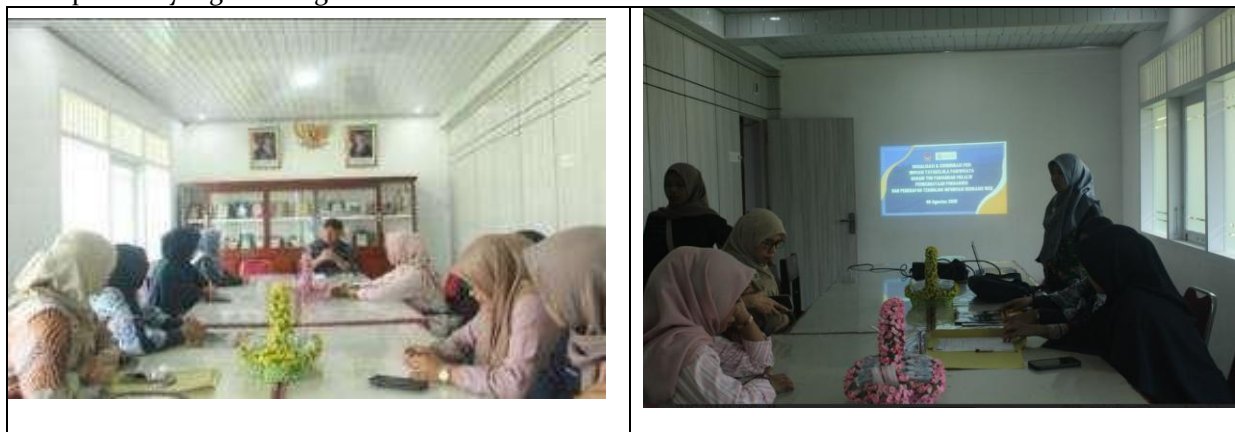
Gambar 1. Rapat Koordinasi tim pelaksana dengan Pokdarwis dan Wali Nagari Pariangan.

Tahapan pertama pada kegiatan ini diawali dengan persiapan, tahap persiapan dimulai pada bulan Juni 2025, Pada tahap ini diawali dengan rapat koordinasi tim pelaksana dengan Pokdarwis dan wali Nagari Pariangan. Pada kegiatan ini diberikan sosialisasi program, dan membahas tujuan dan kebermanfaat program, dan juga menyampaikan peserta yang akan terlibat dalam kegiatan , dan juga persiapan sarana dan prasana yang akan digunakan.