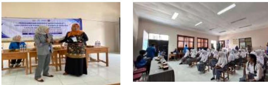
Gambar 1: Kegiatan Pengabdian kepada Masyarakat di SMKN 1 Ciruas

Secara keseluruhan, kegiatan Pengenalan Kecerdasan Emosional untuk Mencegah Konflik dan Perundungan di SMK Negeri 1 Ciruas dapat dikategorikan berhasil mencapai tujuan yang direncanakan. Peningkatan kesadaran emosional, perubahan sikap, serta terciptanya interaksi sosial yang lebih positif menjadi bukti nyata bahwa kecerdasan emosional merupakan aspek penting dalam menciptakan budaya sekolah yang damai dan berkarakter. Kegiatan ini juga memberikan inspirasi bagi institusi pendidikan lainnya untuk mengembangkan program serupa dalam rangka membangun generasi muda yang berempati, berintegritas, dan memiliki daya juang tinggi dalam menghadapi tantangan sosial di masa depan.