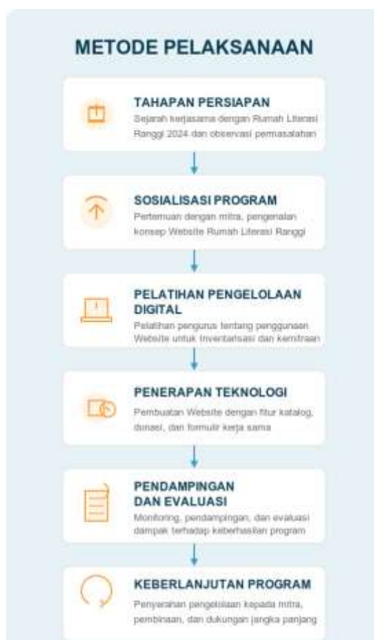
Gambar 1 Metode Pelaksanaan Kegiatan Pengabdian Kepada Masyarakat

Berikut ini adalah tahapan pelaksanaan program pengabdian masyarakat (lihat gambar 1)