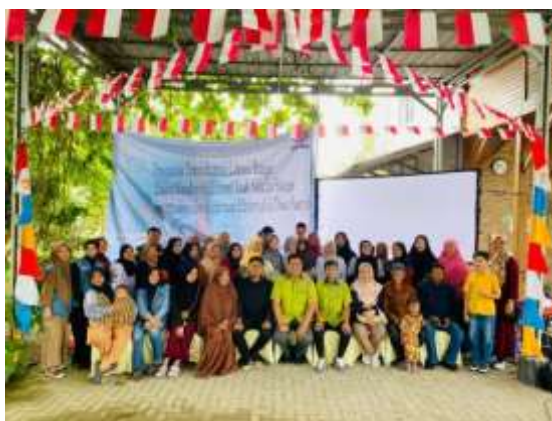
Gambar 4. Foto Bersama Masyarakat, Mahasiswa dan Dosen Selesai Pemaparan Materi sosialisasi