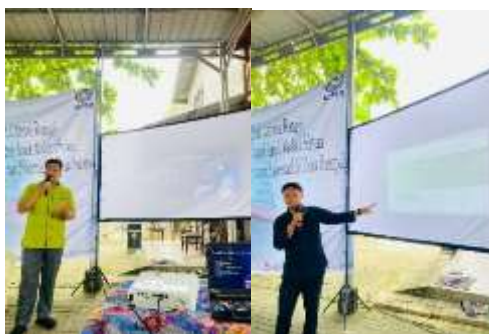
Gambar 3. Tim saat melaksanakan sosialisasi